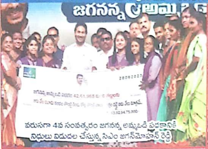
వరుసగా 4వ సంవత్సరం జగనన్న అమ్మడి పదకానికే నిధులు విడుదల చేస్తున్న సీఎం జగన్మోహన్ రెడ్డి

సంపుటి: 13 సంకెతం: 07 సంపాదకులు: పి. శ్రీనివాసరావు నెం: 9441028148 జూలై: 2023 పేజీలు: 20 ధా. 10/-